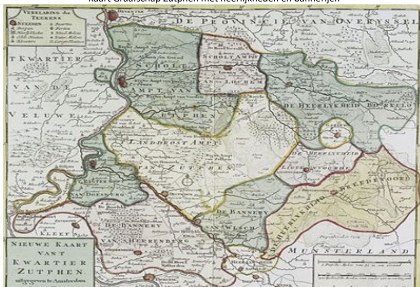
Kaart Graafschap Zutphen met heerlijkheden en bannerijen

Bredevoort, Borculo, Lohn en Anholt. Zo bezien waren er dus ook veel “grenzen”, want zij waren veelal niet zo duurzaam en liepen gemakkelijk in elkaar over. Dat die grenzen snel konden veranderen had alles te maken met de onderlinge machtsstrijd tussen de adellijke heren, die voortdurend aan het vechten én huwen waren om hun machtsgebied te vergroten (dynastieke politiek). Naar zijn aard, was het leen- of feodale stelsel een ingewikkeld